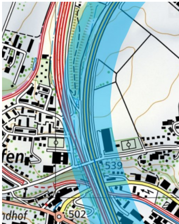
Abbildung 4: Lage und Konsultationsbereich der Nationalstrassen

(KonsBereich_F) als hellblaue Fläche (Farbwert R: 150, G: 200, B: 200, 50% transparent) auf einem gemeinsamen Layer visualisiert.