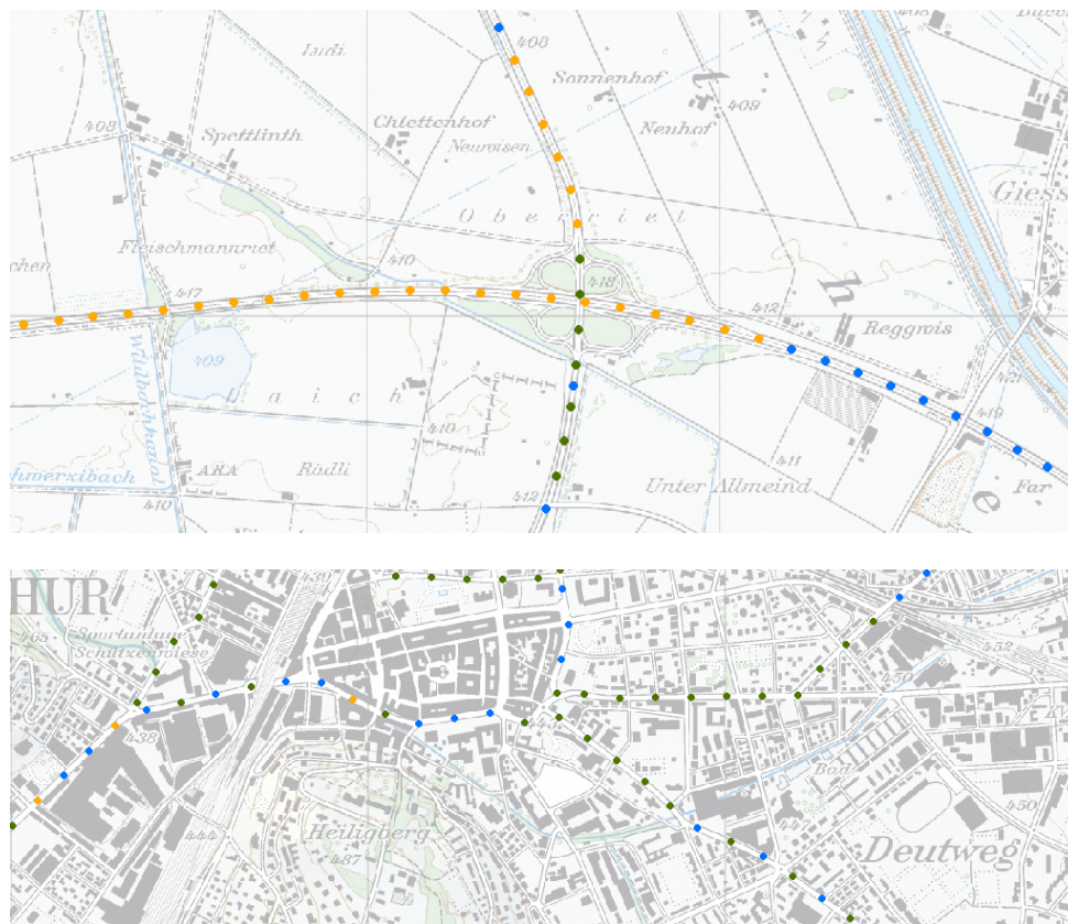
Abbildung 1: Datenpunkte (oben: Nationalstrassen, Darstellung aus MISTRA STR; unten: Durchgangsstrassen) im 100 Meter Abstand

Die Strassenachsen der Nationalstrassen gemäss Geobasidatenmodell ID 86.1 stammen aus dem MISTRA Basissystem. Sie werden vom ASTRA gepflegt. Die Strassenachsen der kantonalen Durchgangsstrassen werden von den Inhabenden dieser Strassen bereitgestellt. Deren Pflege wird meist von den Kantonen wahrgenommen, z.T. aber auch von swisstopo und von Gemeinden.